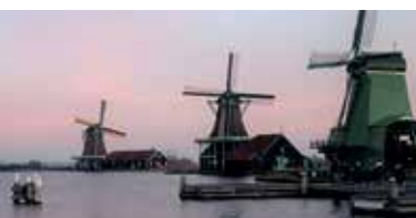
Zaanstreek • Waterland