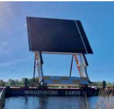
Het brugdeel wacht op plaatsing