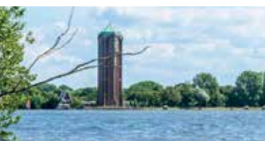
Aalsmeer • Meerlanden