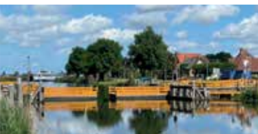
Kop van Noord-Holland