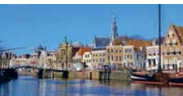
Haarlem • IJmond